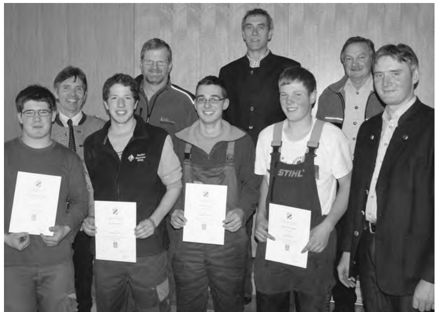
Die Bestplatzierten Junglandwirte mit Amtsleitern und Ausbildern

Nach Abschluß der Prüfungen wurde im GH Höhensteiger in Rohrdorf gemeinsam Mittag gegessen, das die WBV für die angehenden Junglandwirte gerne spendierte. Nach der Kräftigung wurden die einzelnen Disziplinen von den beteiligten Prüfer noch mal erläutert.