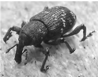
Der große braune Rüsselkäfer

Der Käfer bevorzugt zum Brüten frische Nadelholzwurzelstöcke. Er legt seine Eier in die frische Rinde der Stöcke. Von dort ausgehend befällt der Käfer insbesondere junge Nadelholzpflanzen und benagt v.a. bodennah die Rinde dieser kleinen Bäume. Hierdurch wird der Saftstrom gestört oder unterbrochen. Dies führt zu