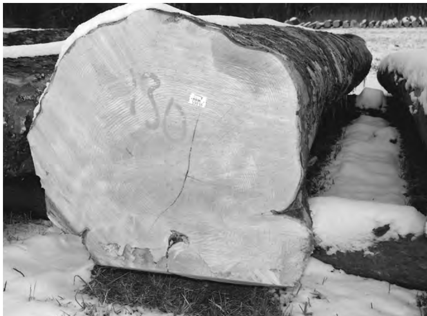
Die „Braut“ der Submission

Nachfolgend die Aufstellung der einzelnen Holzarten mit Menge und Höchstpreis.