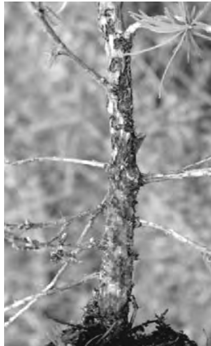
Fraßspuren an einer Jungpflanze

große, trichterförmige Pockennarben die der Käfer durch Rinde und Kambium frißt. Die Fraßspuren reichen von punktuellen bis hin zu flächigen Verletzungen. Ist bereits in einem Jahr ein Befall zu erkennen, muß man im Folgejahr mit weiterem bzw. vermehrtem Auftreten rechnen!