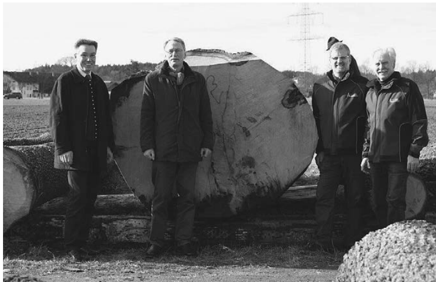
Eiche 4,50 m lang – mit 1,25 m Durchmesser

Mit den erzielten Erlösen war die Waldbesitzervereinigung Rosenheim sehr zufrieden. Laub- und Nadelstammholz von guter Qualität konnte