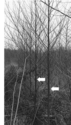
Roterle-pflanzung, 4 Jahre nach der Pflanzung: ca. 5-8 m Höhe, ca. 5-10 cm Brusthöhen-durchmesser

Ein zusätzlicher Aufwand kann noch entstehen wenn ein Fegeschutz angebracht werden muss. Durch die Verwendung der großen Pflanzen ist damit zu rechnen, dass auf ein Ausmähen verzichtet werden kann. Das